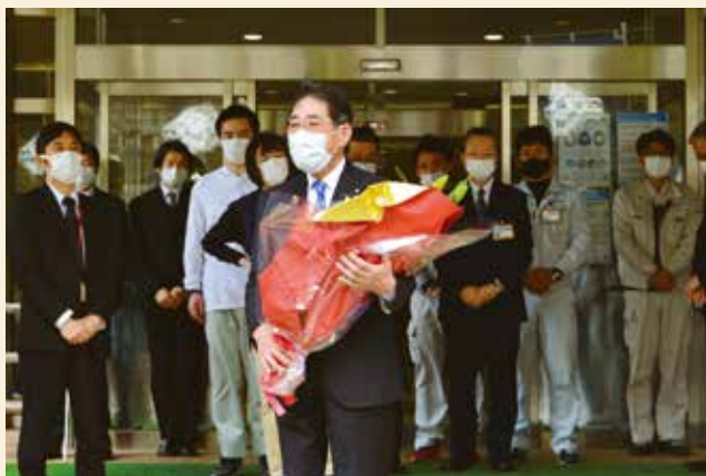
▲4月23日退任式。20年間ありがとうございました。

新型コロナウイルスにより、生活そのものが大きく変わり、改めて山村のあり方が見直されています。村民の皆さまにおかれましては、十津川精神を誇りに、お互いに助け合い支え合いながら、健康で過ごしてくださいませよう祈念いたしまして、退任のご挨拶いたします。