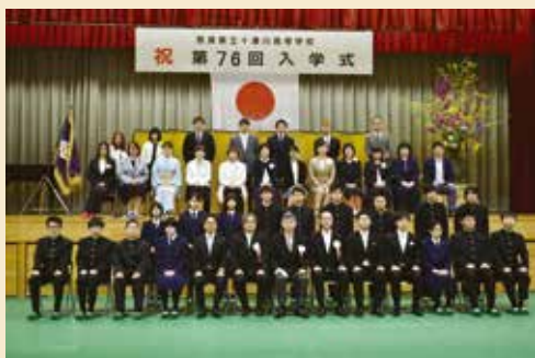
1組 ふるさと共生コース

4月9日に本校体育館で第76回入学式が行われました。新型コロナウイルス感染防止のため、在校生のいない形での開催となりましたが、厳粛な雰囲気の中挙行し、ふるさと共生コース16人、木工芸・美術コース11人の計27人が新たに十津川高校の一員となりました。新入生のこれからの活躍に期待します。3年間、彼らの成長を見守ってください。