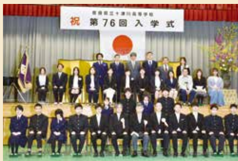
2組 木工芸・美術コース