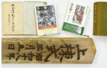
左上から:『贈正五位乾十郎事蹟考』、『熊野木遣節』、『護良親王』、『伴林光平全集』、上湯川国民学校の棟札